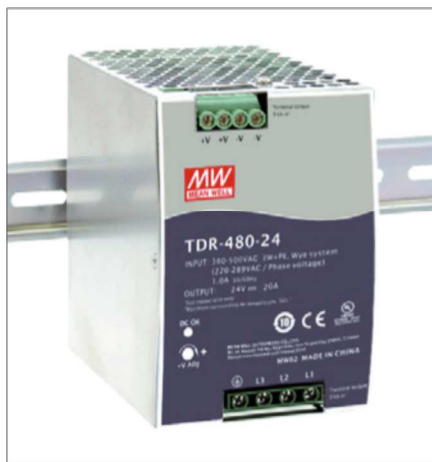
Obr. 1. Řada zdrojů TDR s třífázovým vstupem

Jeden z největších výrobců spínaných napájecích zdrojů na světě MEAN WELL má v nabídce také typy, které je možné s výhodou napájet třemi fázemi. Přínosem tohoto řešení může být menší zátěž vedení napájecí soustavy, a tedy menší ztráty, a především