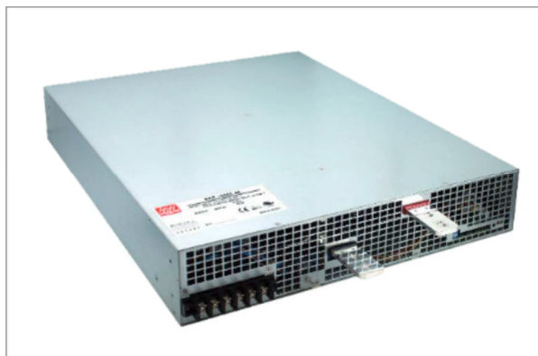
Obr. 2. Stolní 10 kW zdroj série RST s třífázovým vstupem

ženým napětím bez nulového vodiče. Přednostmi typů TDR je malá šířka a pasivní chlazení s tichým chodem, umožněným vysokou účinností – až 94,5 %. Zdroje řady TDR jsou vyráběny ve výkonech 480 nebo