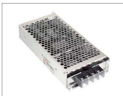
Obr. 2. Měnič RSD 300

Široký rozsah vstupního stejnosměrného napětí je základní charakteristikou mě-