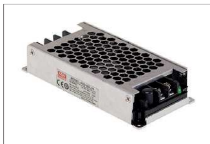
Obr. 1. Měnič RSD 60

Konstrukce měničů RSD odpovídá normám vztahujícím se na drážní zařízení. Jde o normu EN 50155, platnou pro všechna elektronická zařízení pro řízení, regulaci, ochranu, napájení atd., instalovaná na kolejových vozidlech a spojená buď s akumulátorem baterií vozidla, nebo s napájecím zdro-